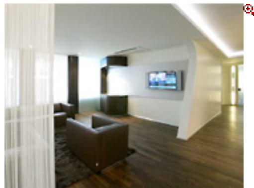
Warten wie im Designhotel: Zahnarztpraxis am Opernplatz. (Bild zum Vergrößern anklicken)